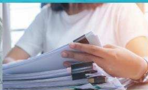
Регуляторні нормативні документи