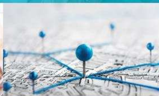
Знайти найближчий пункт вакцинації