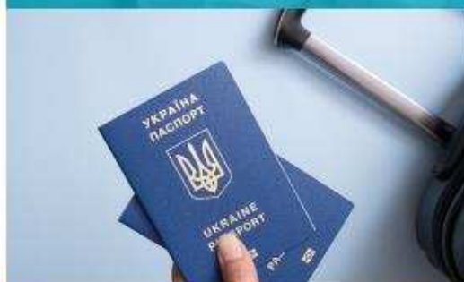
Мандрівники, біженці, мігранти