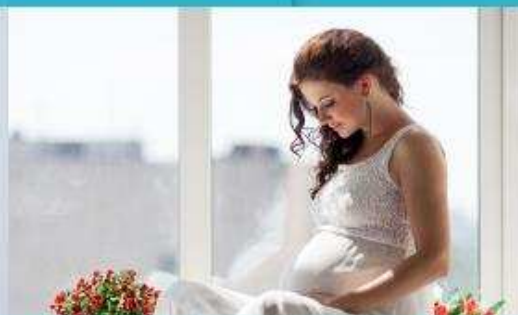
Вагітні / лактація