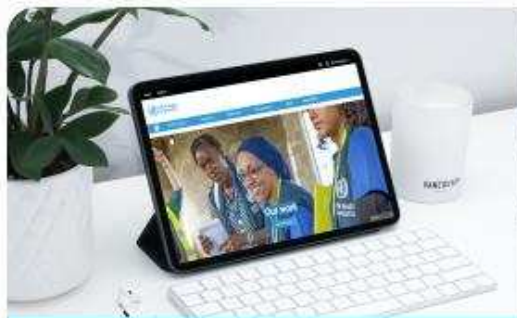
Джерела інформації про вакцинацію