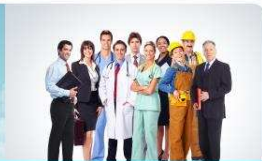
Вакцинація за професіями