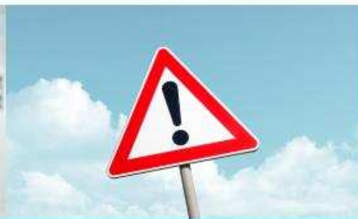
Групи медичного ризику